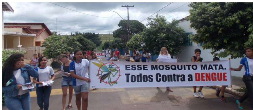
Mobilização em São Paulo (SP), realizada no dia 21/03, pela Escola Estadual Edir Sgavioli Faccioli

Clique aqui e veja os depoimentos na íntegra