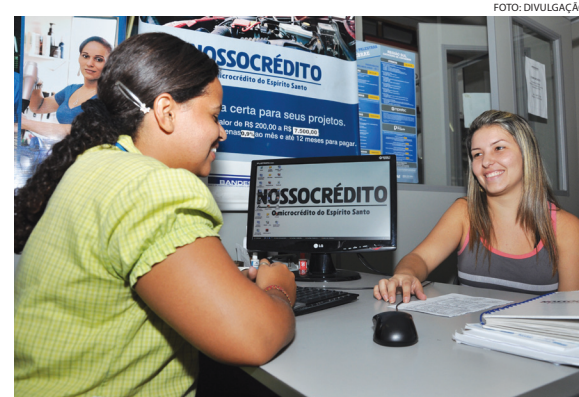
O microcrédito aumentou 82% em 2011