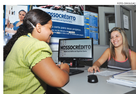
O microcrédito aumentou 82% em 2011.

Data de criação: 11/11/1890 População 2010: 189.889 habitantes População 2011(estimativa): 191.042 habitantes Área: 876,795 km 2 Empresas: 6.080 Pessoal ocupado: 48.812 PIB per capita: R$ 11.919,98 PIB municipal: R$ 2,4 bilhões • Agropecuária: R$ 32,7 milhões • Indústria: R$ 572,3 milhões • Serviços: R$ 1,5 bilhão • Impostos: R$ 326,5 milhões